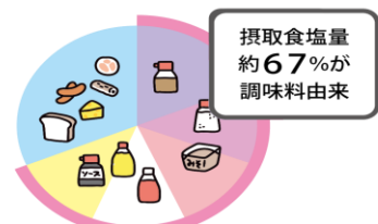
厚生労働省 令和元年 国民健康・栄養調査より作成

日本人が摂取している塩分のうち、調味料由来が67%となっています。減塩するには、「調理に使う調味料」、また「料理にかける食卓調味料」を減らすことが有効です。子どもが好きなマヨネーズ、ドレッシング、ケチャップ、ソースの使い過ぎには注意しましょう。